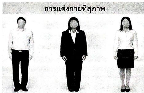
การแต่งกายที่สุภาพ สำหรับการสมัครสอบ

สุภาพบุรุษ สวมเสื้อเชิ้ตมีปก กางเกงขายาว (ห้ามสวมกางเกงยีนส์) โดยสอดชายเสื้อไว้ในกางเกง สวมรองเท้าหุ้มส้นหรือรองเท้าคีบ ประพฤติตนเป็นสุภาพชน และไม่รับสมัครผู้ที่แต่งกายไม่สุภาพ